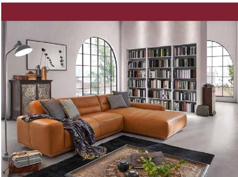
Potah: Z79/51 brandy